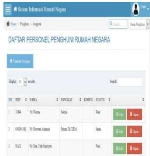
Gambar 9 Form Personel.

menjalankan form program yang berkaitan dengan pemeliharaan data personel penghuni rumah neg. Form pemeliharaan data tersebut yaitu data personel dan data keluarga.