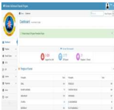
Gambar 8 Form Menu Utama.

Menu penghuni berisi dua sub menu yang berfungsi untuk