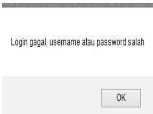
Gambar 7 Jendela Pesan Gagal Login.